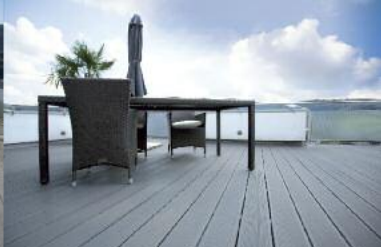
4. Perfektes Ergebnis nach der Behandlung mit WPC-Imprägnier-Öl