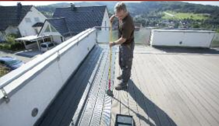
3. Anstrich mit WPC-Imprägnier-Öl auftragen. Nach Trocknung: Je nach Saugfähigkeit 2. Anstrich vornehmen.