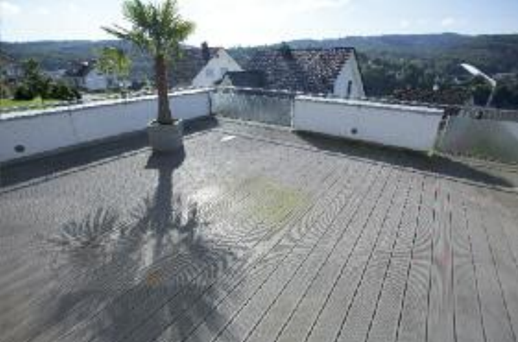
1. Terrassenboden im Ist-Zustand