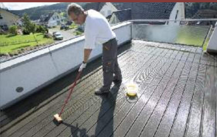
2. Ggf. Reinigung mit Remmers Holz-Entgrauer